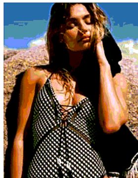
Laccetti impreziosiscono il modello Watercult