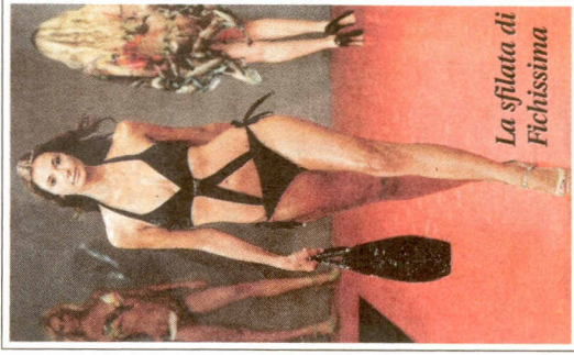
La sfilata di Fichissima

possono abbinare diversi slip dal brasiliano fino al più classico. Dettagli gioiello invece per Parah che arricchisce con pietre semipreziose i suoi costumi. Sempre bikini per Les Copains che spaziano dal triangolo scorrevole all'imbottito, dalla fascia al ferretto. I colori osano dal rosso al verde acido e sono proposti in un particolare sfumato chiaro-scuro che viene enfatizzato dall'arricciatura del tessuto. Per le ragazze è il momento di osare con colori spiritosi quali l'azzurro, l'arancione e il fucsia in tonalità fluo per fantasie multicolor. Suan lancia l' underbeach , ovvero un intimo abbinato all'abbigliamento fuori spiaggia da portare a vista sotto gli impalpabili tessuti dei copricostume.