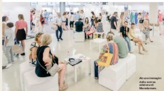
Alcune immagini della scorsa edizione di Maredamare.

Dal 14 al 16 luglio la Fortezza da Basso di Firenze ospiterà l'undicesima edizione di MARE DAMARE , l'unico salone professionale italiano dedicato al beachwear che presenterà in anteprima le collezioni per l'estate 2019. Oltre 200 i marchi presenti nel salone, tra italiani e internazionali provenienti da Australia, Belgio, Brasile, Colombia, Finlandia, Francia, Germania, Gran Bretagna, Grecia, Paesi Bassi, Polonia, Portogallo, Slovenia, Spagna, Stati Uniti e Svizzera. Sono tante le new entry e i ritorni importanti. Tra i nuovi espositori internazionali ci saranno l'australiano Seafolly, 100% Brasil, Maaji dalla Colombia, dalla Finlandia Brissus - Sustainable Swimwear, dalla Francia Beliza, dalla Grecia Aelia Anna, per il Portogallo Enamorata, mentre per la Spagna ci saranno Luna Elena, Malmok, Mele Beach e Pat&Can. Grazie all'accordo con ABIT (Brazilian Textile and Apparel Industry Association), questa edizione vedrà