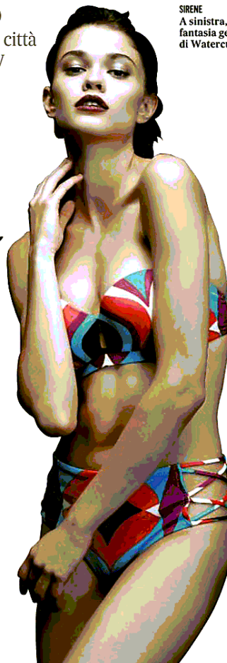
SIRENE A sinistra, fascia e slip alto per il bikini in fantasia geometrica di Parah. Sotto, il triangolo di Watercult ha inserti effetto lingerie

Per quanto riguarda le tendenze, le linee e i colori anche per il